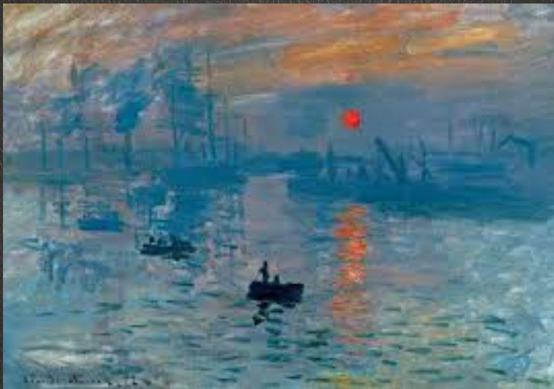
Impression soleil levant, Claude Monnet (1872)