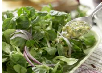
KÄSESALAT Salade avec morceaux de fromage.