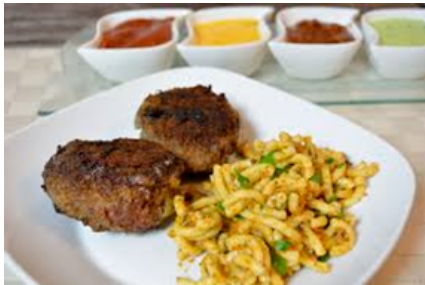
BERLINER BULETTE Boulette de Berlin (viande hâchée –épices).