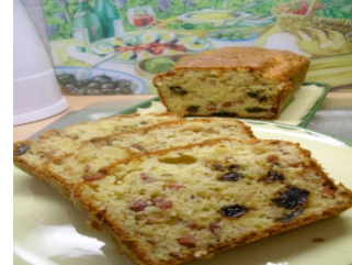
SPECK-PFLAUMEN-CAKE Cake salé aux lardons et aux pruneaux.