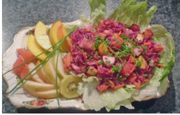
ROTKOHL MIT ÄPFELN UND BIRNEN Chou rouge avec morceaux de pommes et de poires.