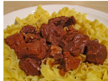
GULASCH Goulache .

mit SPÄTZLEN serviert / servi avec des spaetzle*